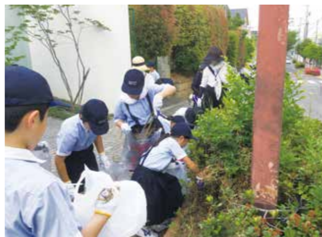
清掃作業 Litter Clean-up