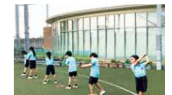
スナッグゴルフ SNAG Golf