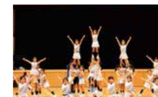
チアリーディング Cheerleading