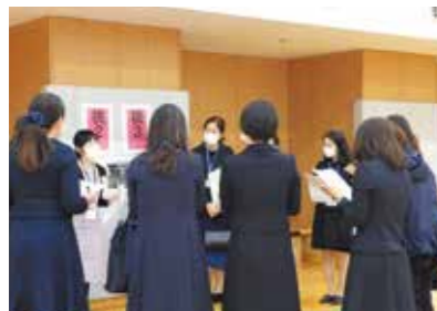
色別下校班保護者会