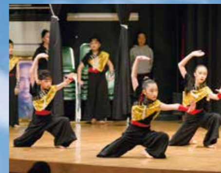
台湾聖心小学校への訪問 Visiting Sacred Heart Primary School, Taiwan