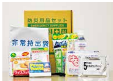
非常持ち出しセット(個人用)