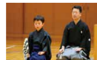
能 Noh Theater