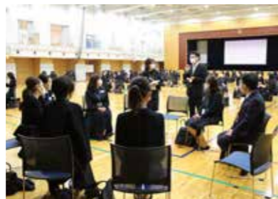
保護者対象異学年交流会