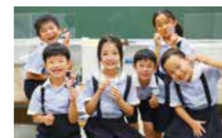
南山っ子スクール Nanzan-Ko-School