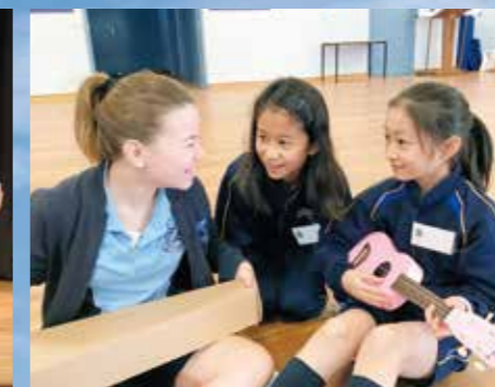
オーストラリア/現地校での生活 Australia / School Life