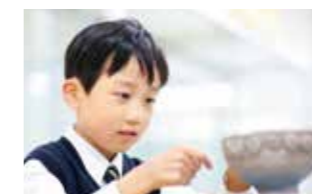
陶芸 Ceramic Arts