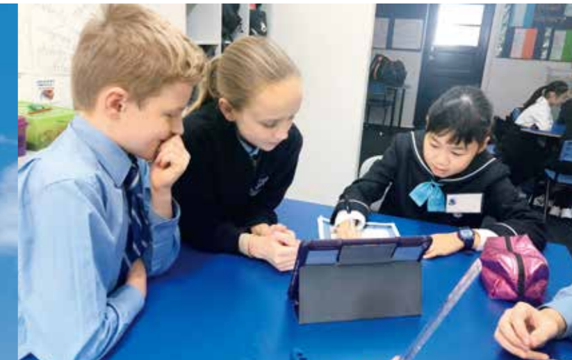
オーストラリア/共に学び合う Australia / Learning Together

海外に赴き、さまざまな文化を体験する海外研修を行っています。また、カードやビデオレターの交換、ビデオチャットを行って親交を深める学校間交流などをオーストラリア・カナダ・台湾と行っています。人との出会いを大切にすることで、自然に国際性を身につけることができます。