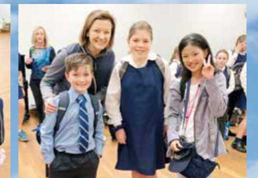
オーストラリア/さまざまな出会いが待っている Australia / Various Encounters Await