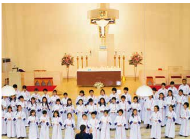
聖歌隊(チャリティーコンサート) Choir (Charity Concert)

宗教曲を中心に愛らしい歌声を響かせる病院での歌唱奉仕、チャリティーコンサートや、毎年保護者、教員とともに学校周辺の道路脇や植え込みの奥のごみを拾う地域清掃活動など。いつも見守ってくださる学校近隣地域に対し、奉仕と感謝の気持ちを込めて社会貢献しています。